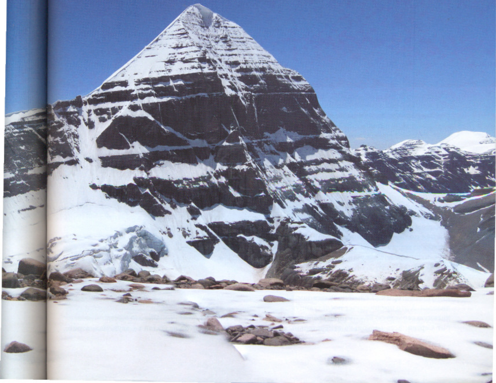
Панорама Восточного Лица Кайласа и каменного зеркала с вершины горы Пакна