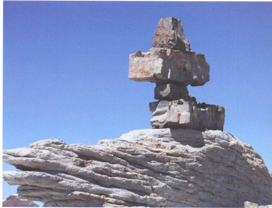
Каменный крест на западном гребне внутренней коры

Каждый раз участники экспедиций посещают новые, никем до этого не изученные места. Сама мандала Кайласа – природное образование, но на западном гребне внутренней коры были найдены так называемые «скульптуры» – каменные образования со следами обработки человеком. Уникальная энергетика места, располагающая к духовным практикам, наве-