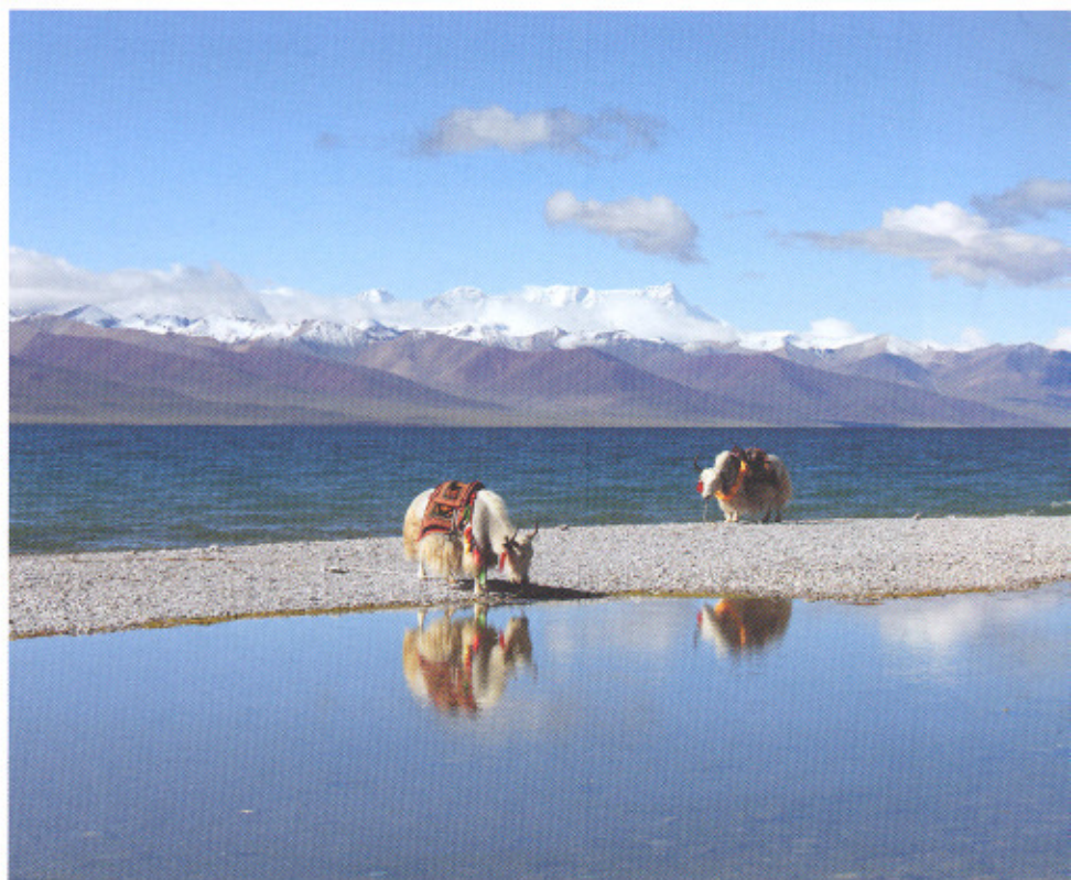
Озеро Нам-Цо на фоне горы Тангла