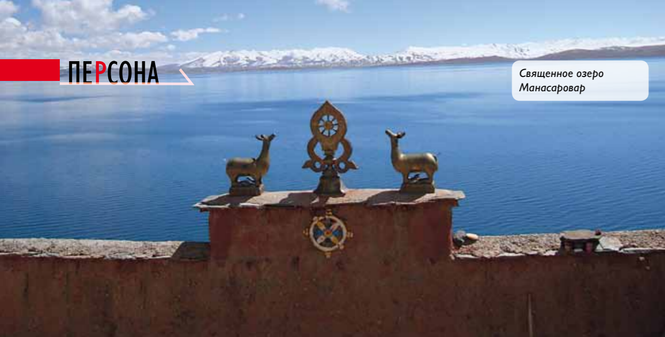
Священное озеро Манасаровар