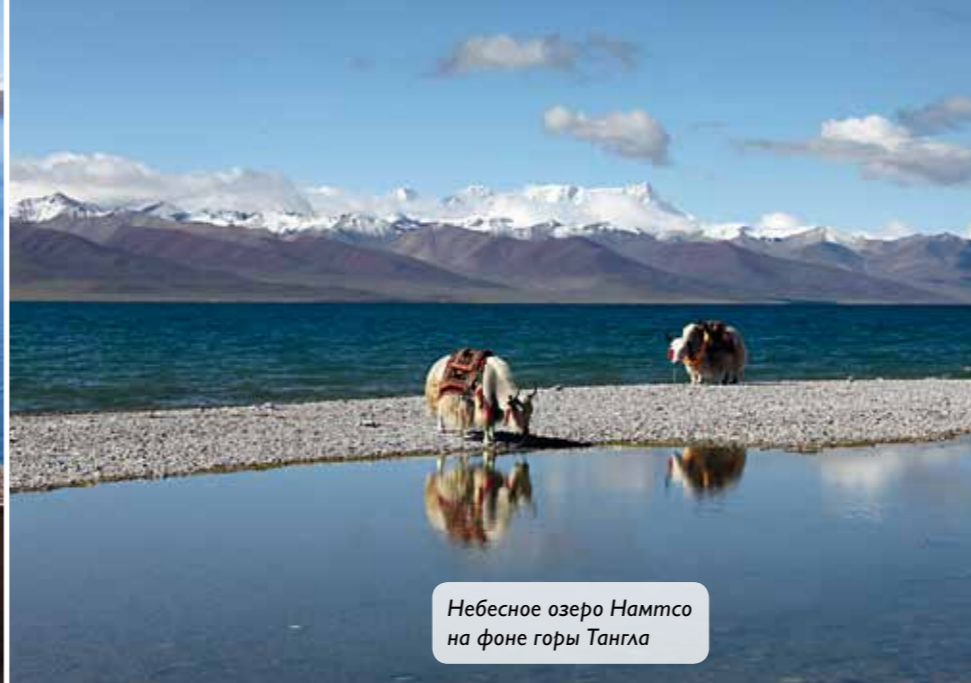
Небесное озеро Намтсо на фоне горы Тангла